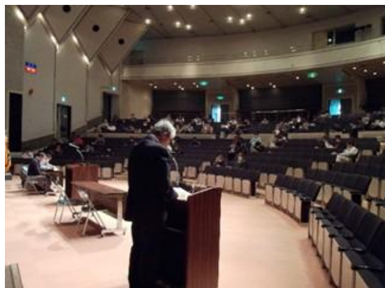
年末の交通安全県民運動実施に伴う説明