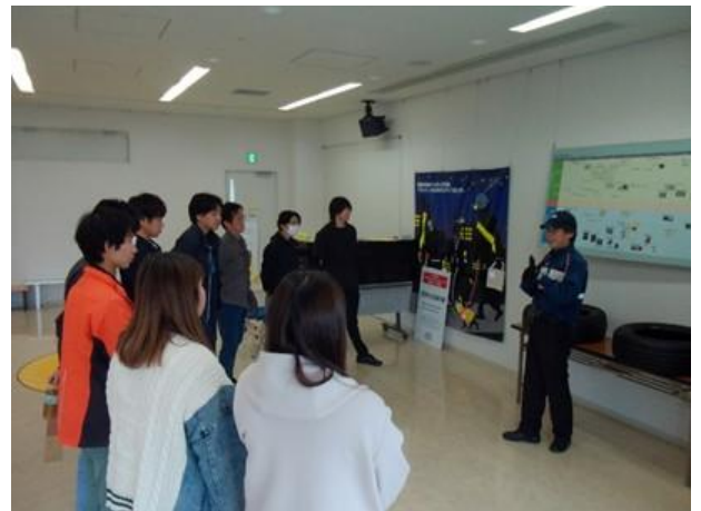
タイヤ点検方法教養