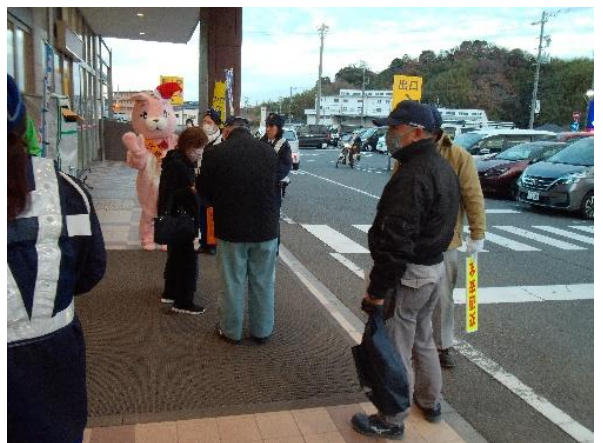
反射材等配布状況