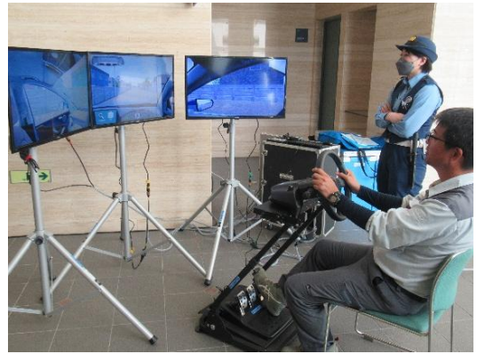
ドライブシミュレーター