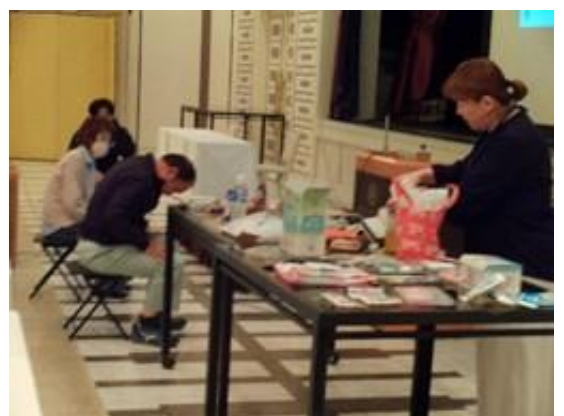
研修受講状況（使用体験）