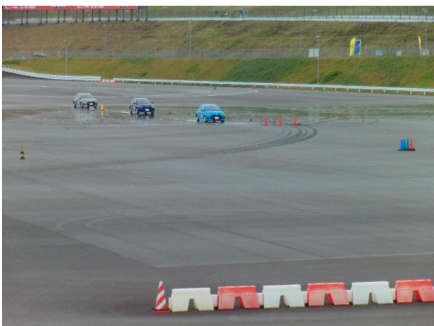
高速フルブレーキング体験