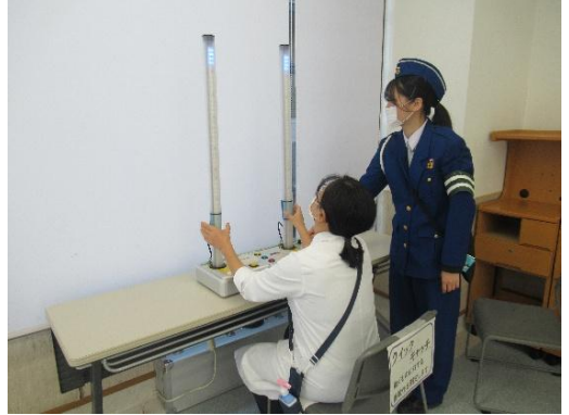
クイックキャッチ