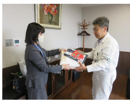
株式会社アツミテック