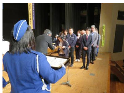
標語コンテスト表彰