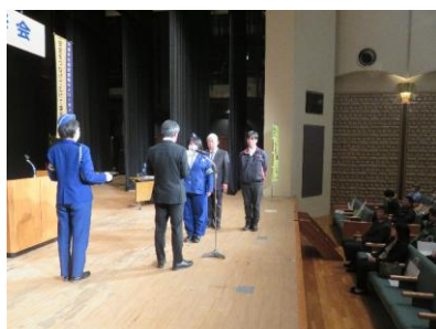
エコドライブコンテスト表彰