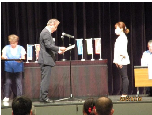
【団体賞10人未満チームの表彰】