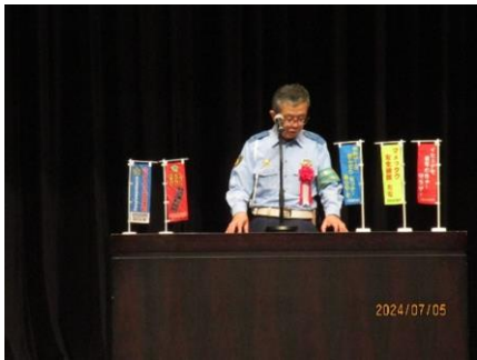
【焼津警察署長挨拶】