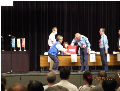
【特別賞の抽選状況】