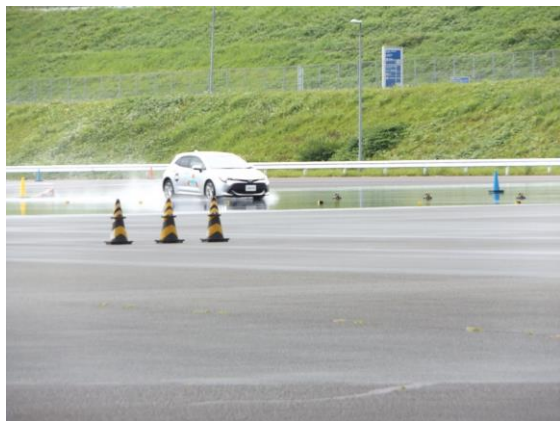
【高速フルブレーキング体験】