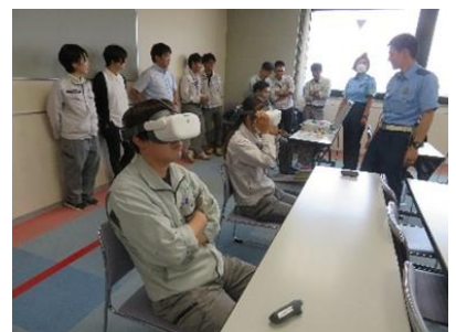
【VR機器による疑似体験】