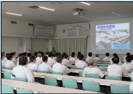
【警察官による講話】