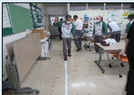
【VR機器・反射能力機器・飲酒ゴーグルの受講状況】