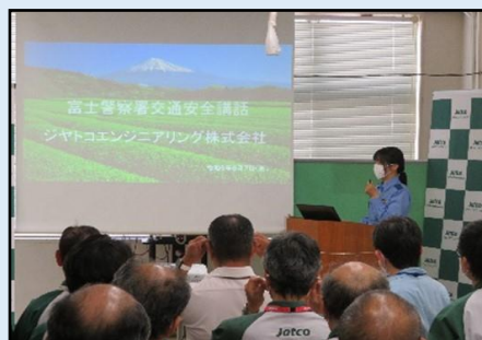
【管内の交通情勢の講習】

時： 令和6年6月7日（金） 14:00～15:00 所： 富士市依田橋125番地の1 ジヤトコエンジニアリング(株) 要： 60歳以上の再雇用従業員（20人）に対する講習会として管内の交通事故状況の説明に続き、交通事故の疑似体験（VR機使用、反射能力の確認、飲酒ゴーグル等）を実施しました。 参加者からは「交通事故をしたことはなかったけど疑似体験で交通事故の恐ろしさが分かり、更に自分の反射神経の衰えも分かったので今後は慎重に行動をとります。」等多くの意見が寄せられました。