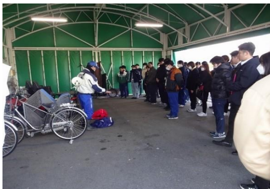
【実技（夜間視覚特性）】