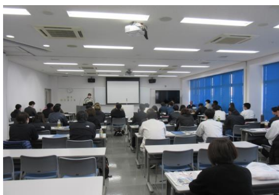
【座学（レインボーインストラクター）】