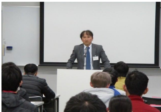
【主催者（浜松市） あいさつ】