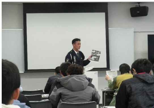
【座学（浜松西警察署）】