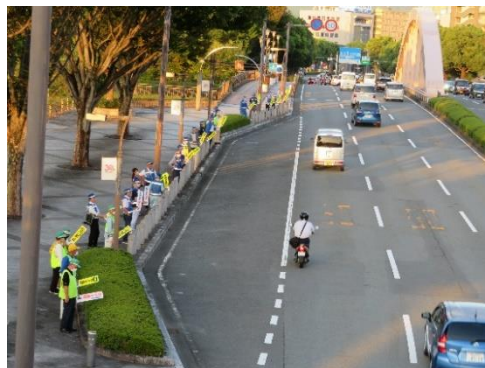
【街頭広報活動の状況】