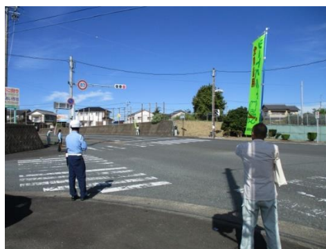
【のぼり旗を持つての交通安全街頭広報の状況】