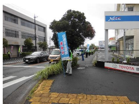
【静岡銀行磐田支店前交差点における広報活動】