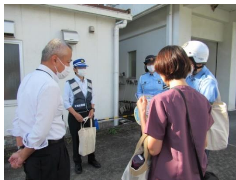
【従業員に対する、交通安全声掛け活動の状況】