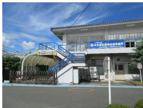
推進事業所に掲示された横断幕