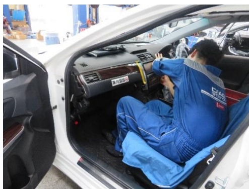
取り付け作業状況

(株)ノダ富士川事業所からは、「従業員の事故防止に活用したい。」とのコメントがありました。