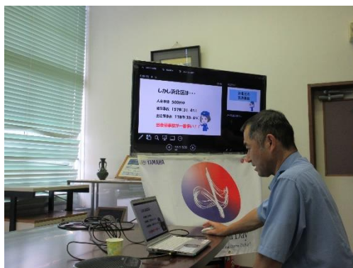
同工場会議室から配信

安全運転管理者である平包（ひらがね）工場長から「連休前の交通安全意識の向上に、非常に効果的な内容で、大変感謝しております。」と浜北警察署及び当地区安全運転管理協会に対して謝意がなされました。