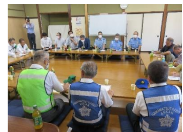
【再発防止策の検討】