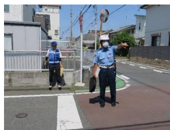
【事故現場での説明】