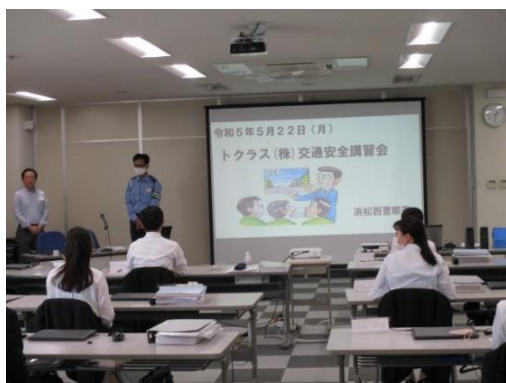
【交通安全講話の受講状況】