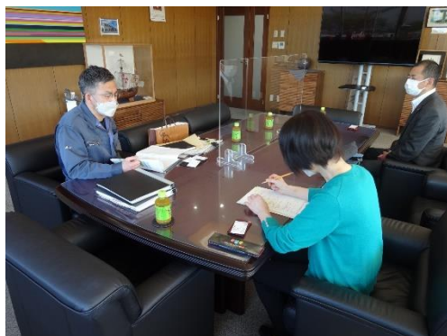
【㈱アオイへの訪問状況】