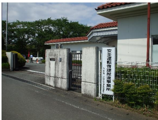
【推進事業所における講習会】