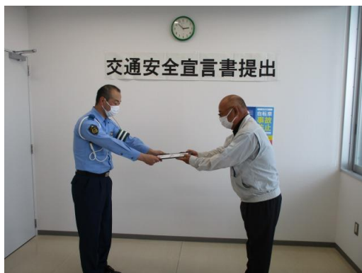
【交通安全宣言書の提出状況】

当社では、提出された宣言書の写しを、社内食堂に1年間掲示して、常に社員一人一人の交通安全意識を高めることとしています。