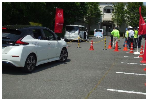
【自動駐車システム体験状況】