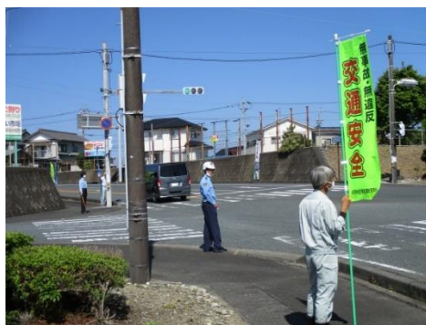
【浜松市平和清掃事業所職員による街頭広報の実施状況】

活動内容： 浜松西地区安管協会の会員事業所である 浜松市平和清掃事業所の職員8人 が、春の全国交通安全運動期間中に、浜松西警察署署員、安協浜松西地区支部交通指導員及び 地区安管協会事務局長 と一緒に、のぼり旗を掲出してドライバー、通行人に対して安全運転、交通事故防止の広報を行いました。