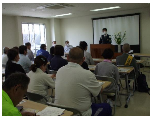
【講習会の受講状況】