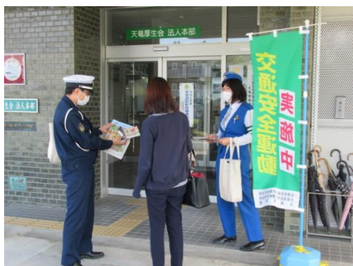
【従業員に対する交通安全の声掛け活動の状況】

活動内容： 社会福祉法人 天竜厚生会 は、推進事業所の活動の一環として、天竜警察署、安協天竜地区支部及び 天竜地区安管協会 と協力し、従業員（55人）に対し安全運転を呼びかけました。