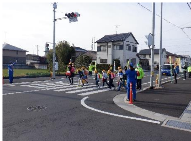
【街頭広報活動の様子】