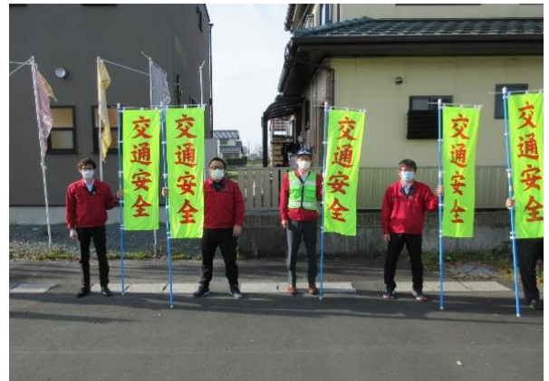
【出発式や街頭広報活動の様子】