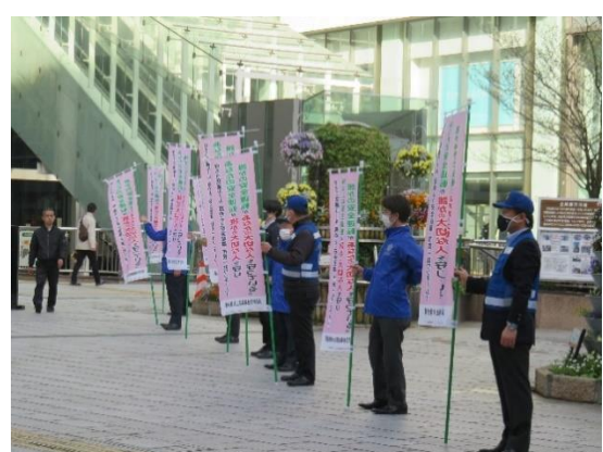
【出発式や街頭広報活動の様子】