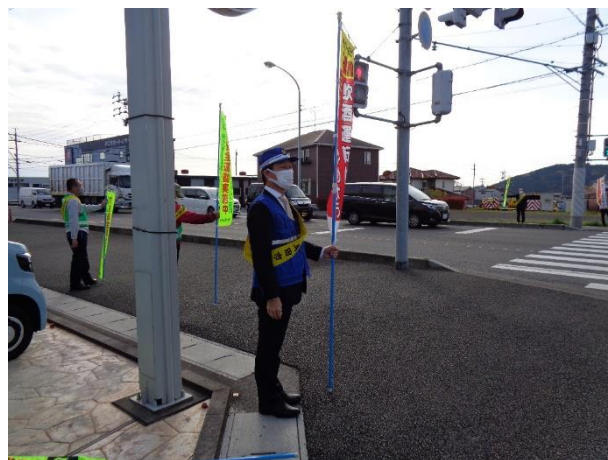
【街頭広報活動の様子】