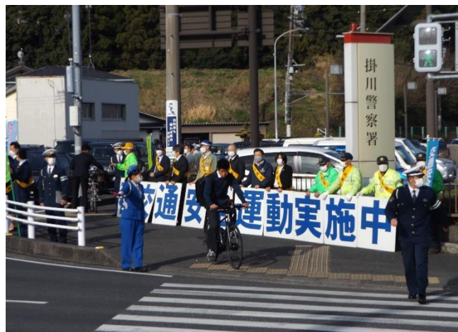
【開始式や街頭広報活動の様子】