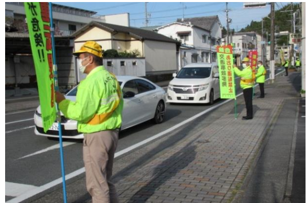
【出発式や街頭広報活動の様子】