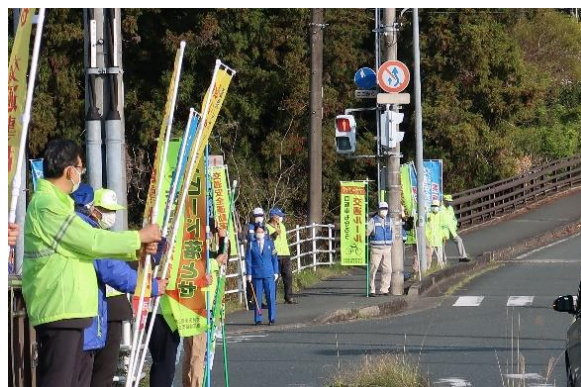
【出発式や街頭広報活動の様子】