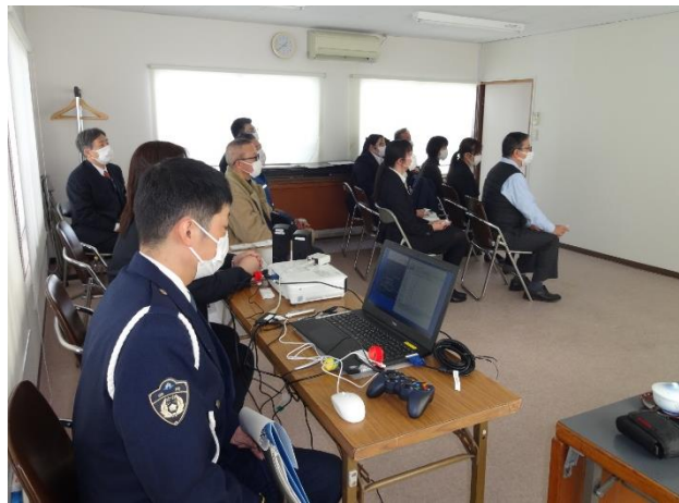
【K Y T（危険予測トレーニング）講習会の開催状況】

実施内容：県警交通部及び御殿場警察署員が講師となり、K Y T（危険予測トレーニング）講習会を行ったもので、終わりに県警交通部員から県下の交通事故発生状況や安全運転ポイントについて講義がありました。参加者らは「これまでの慣れや思い込み運転による危険性と危険予測の重要性が認識できました」等の感想が聞かれました。