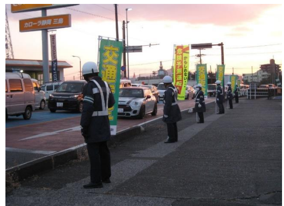
【街頭広報活動を実施、通行車両に安全運転を呼び掛け】