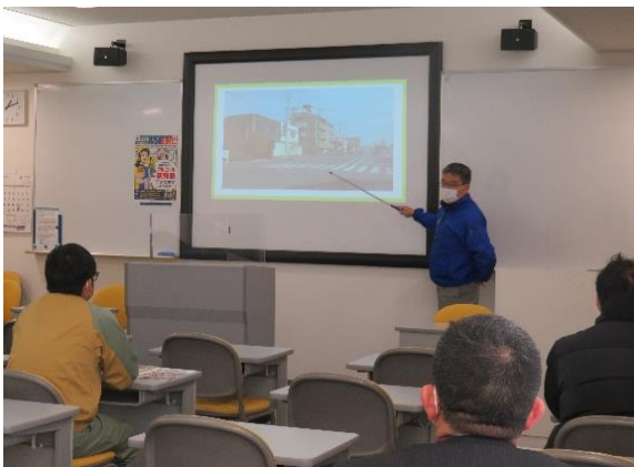
【自動車学校指導員の講話】

活動内容：リスクマネジメント研修は今年度5回目、合計58人が参加しており、 ・ 警察署交通課員の講話、自動車学校指導員の座学 ・ 自動車学校コースと路上における実車研修、OD式運転適性検査など実施したもので、参加者から「自分の運転能力や安全運転の必要性を再認識できた」等の感想が聞かれました。