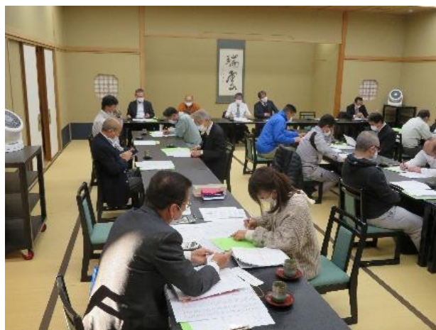
【交通安全スローガンの選考状況】