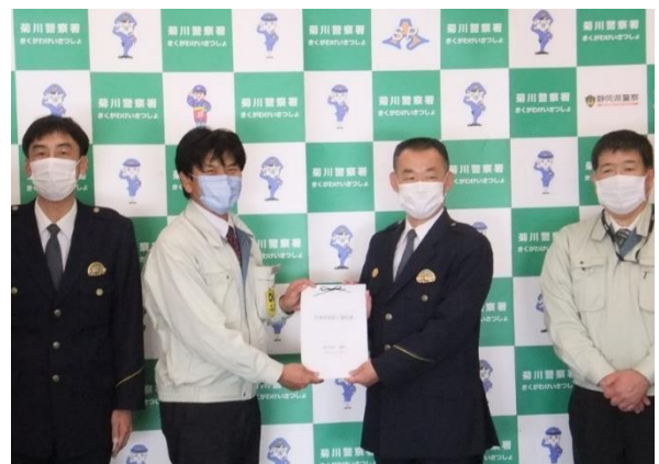
【交通安全宣言書を吉川・菊川警察署へ提出】