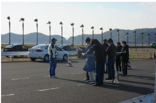
【 浜 松 東 地 区 】