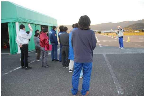
【 細 江 地 区 】