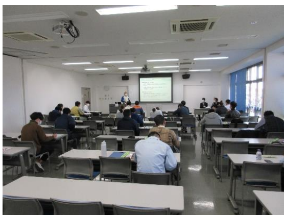
【 浜 北 地 区 】