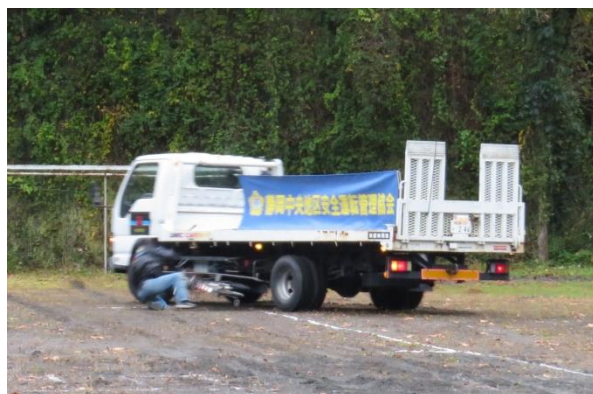
【車の左折巻き込み事故（実演）】