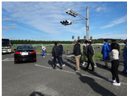
【実技：右折事故のケーススタディ】