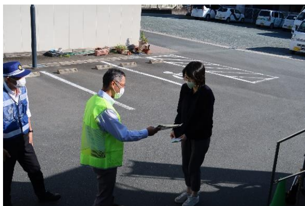
【啓発品を配付して事故防止を呼び掛け】