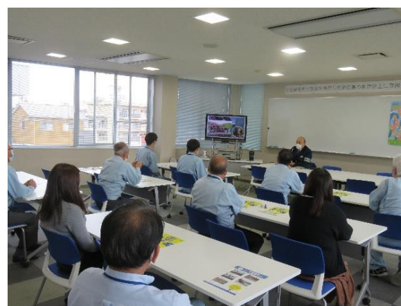
【交通安全講話を聴講する従業員】 （株）トーエネック 浜松営業所