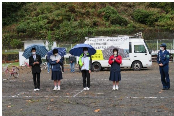
【中学生徒が感想を発表】