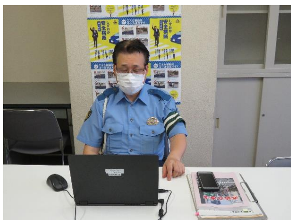
【交通第一課長の交通安全講話（録画）】

本年度安全運転管理推進事業所の交通安全活動として実施したもので、いずれもドライブレコーダーの交通事故映像を中心とした交通安全講話であり、推進事業所従業員の皆さんは、真剣に聴講等していました。