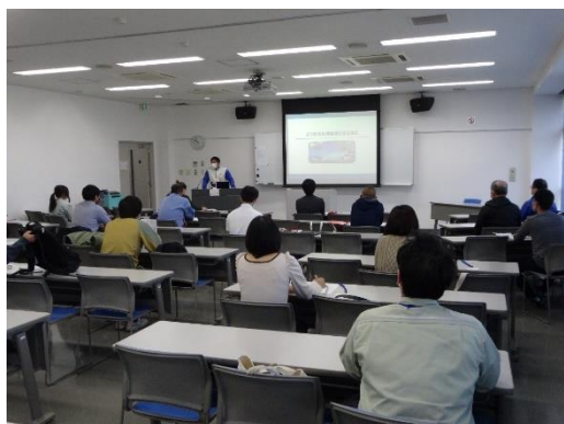
【座学：より安全な運転者になるために】

など体験型の研修会で、参加者から「体験中心で大変参考になった」「研修の結果を自分の運転に生かしたい」等の感想が聞かれました。