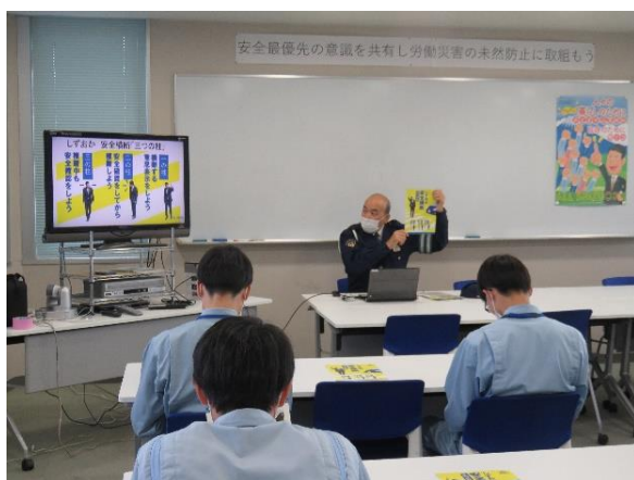
【交通第一係長の交通安全講話】