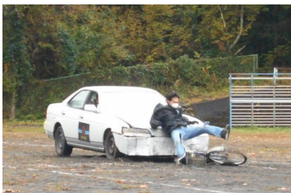
【自転車の飛び出し事故（実演）】

※参加事業所：「井川森林組合」「石福建設㈱」「花菱建設㈱」「㈱山本建材」「㈱ヤマエイ長島建設」