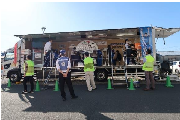
【交通安全講習に参加した皆さん】

実施内容：安管推進事業所職員の交通安全意識の向上と交通事故防止を目的に、県警の「交通安全体験車」を使用し、ドライビングシミュレーター、視野・動体視力診断など体験型交通安全講習を行いました。 参加した職員から「送迎担当で、自分の運転適性が自覚でき、今後も安全運転に努めたい」との感想で、有意義な安全講習となりました。 講習後には、浜松市北区役所の職員から参加者へ反射タスキ等の交通安全啓発品を配布して、交通事故防止を呼び掛けました。