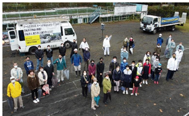
【交通教室に参加した皆さん】