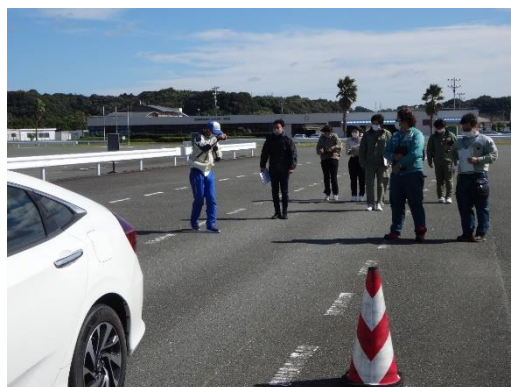
【実技：追突事故防止の反応体験】