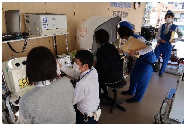
【視野・動体視力計、視野診断計】