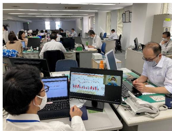
【交通安全講話を視聴する従業員】 遠鉄アシスト（株）