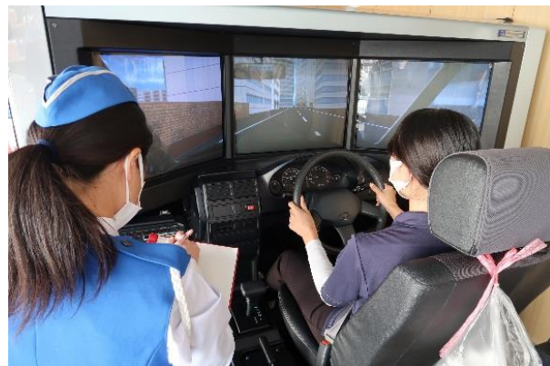
【ドライビングシミュレーター】