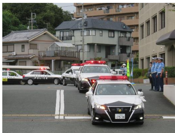
【交通安全運動初日における出陣式の様子】