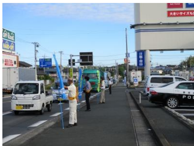
【交通頻繁な交差点において街頭広報活動を実施】