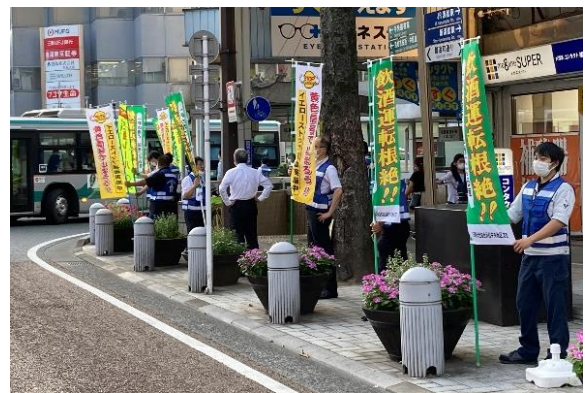
【伝馬町交差点での街頭広報】