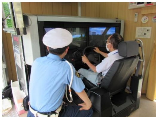
【ドライビングシミュレーターの様子】

実施内容：県警交通安全体験車のドライビングシミュレーターや運転・歩行能力診断、さらに安協天竜地区支部のクイックキャッチ等を使用して体験型交通安全講習を実施したもので、職員一人ひとりが運転技能の認識や交通安全意識の向上を図ることができました。