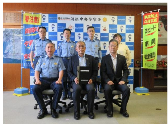
【交通安全宣言書を警察署長に提出】