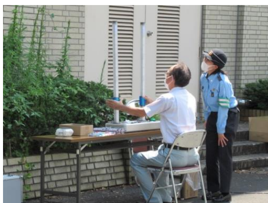
【クイックキャッチの様子】