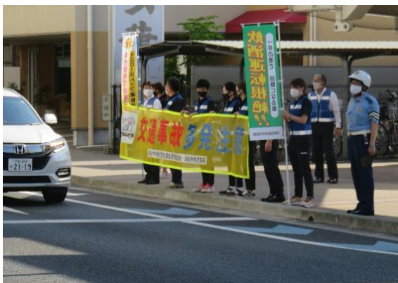
【助信駅前交差点での街頭広報】

広報内容：朝夕の通勤時間帯に合わせ「交通事故多発注意」の横断幕や安全運転を呼び掛けるのぼり旗を掲出して、通学児童や通勤車両に対する交通安全街頭広報を実施しました。